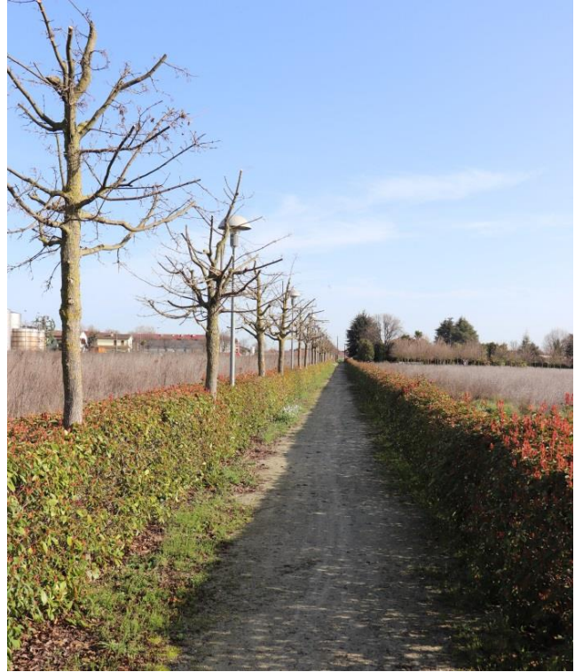
Visione da via Soldata.